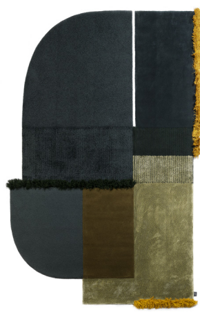
Selce 2 Goethite Blue