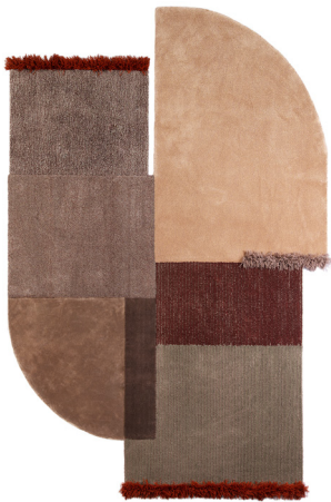
Selce 4 Emathite Red