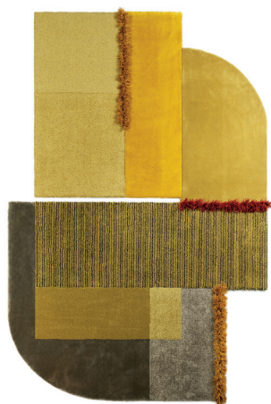
Selce 1 Marcasite Yellow