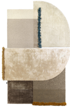
Selce 5 Dolomite Greige