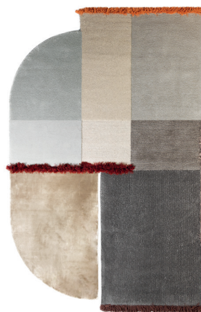
Selce 3 Pyrite Grey

I dati forniti in questa scheda tecnica sono aggiornati al momento della pubblicazione. Carpet Edition si riserva il diritto di modificare materiali, dimensioni e caratteristiche senza preavviso. The data provided in these technical specifications are up to date at the time of publication. Carpet Edition reserves the right to modify materials, sizes and characteristics without notice.